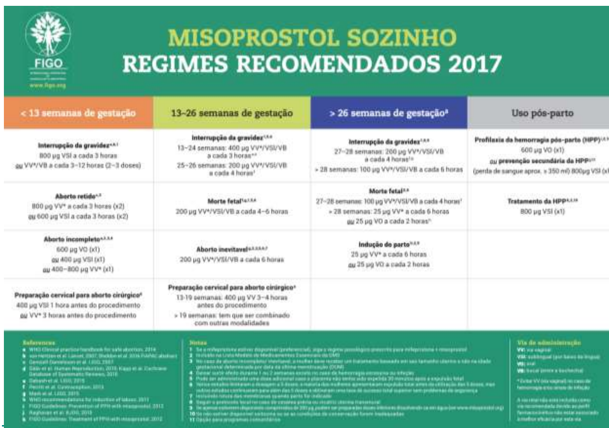
Figura 2 – Protocolo da FIGO (Federação Internacional de Ginecologia e Obstetrícia) para uso de misoprostol na gestação. No Brasil, não há liberação do medicamento por via oral ou sublingual. No item em que se lê esta recomendação para hemorragia pós-parto, deve-se considerar a utilização via retal.

Morris JL, Winikoff B, Dabash R, Weeks A, Faundes A, Gemzell-Danielsson K, Kapp N, Castleman L, Kim C, Ho PC, Visser GHA. FIGO's updated recommendations for misoprostol used alone in gynecology and obstetrics. Int J Gynaecol Obstet. 2017; 138(3): 363-366