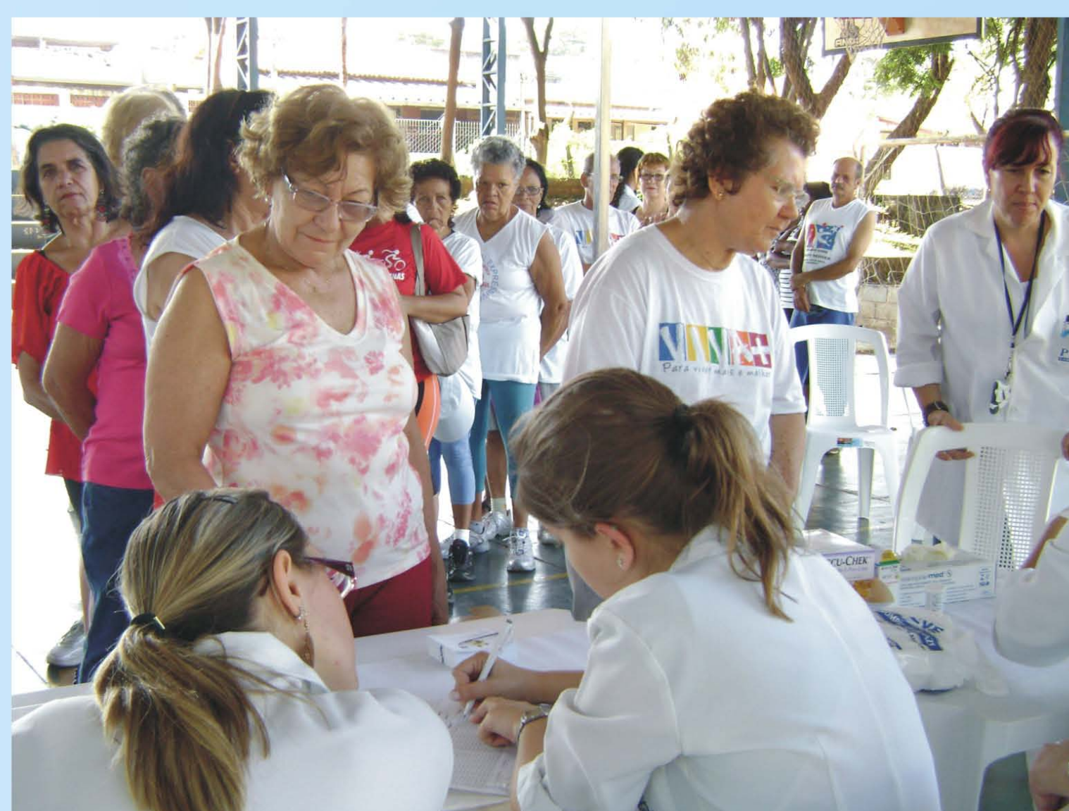
Tenda da saúde