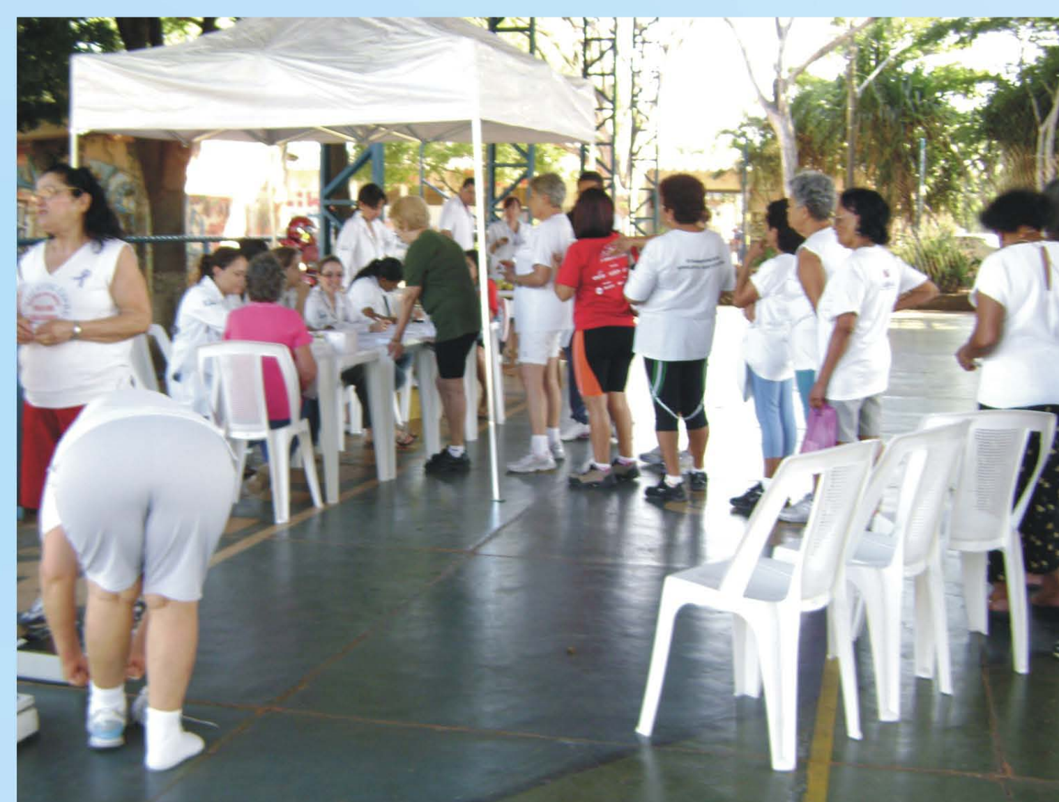
Tenda da saúde