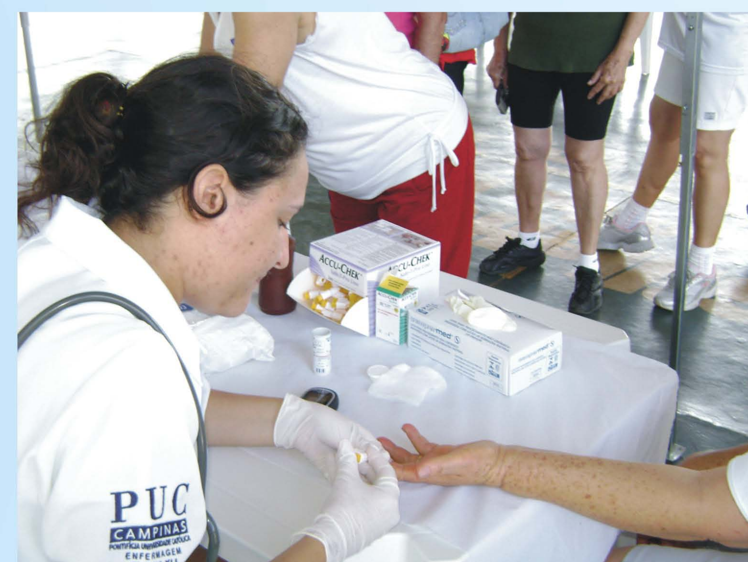
Teste de glicemia