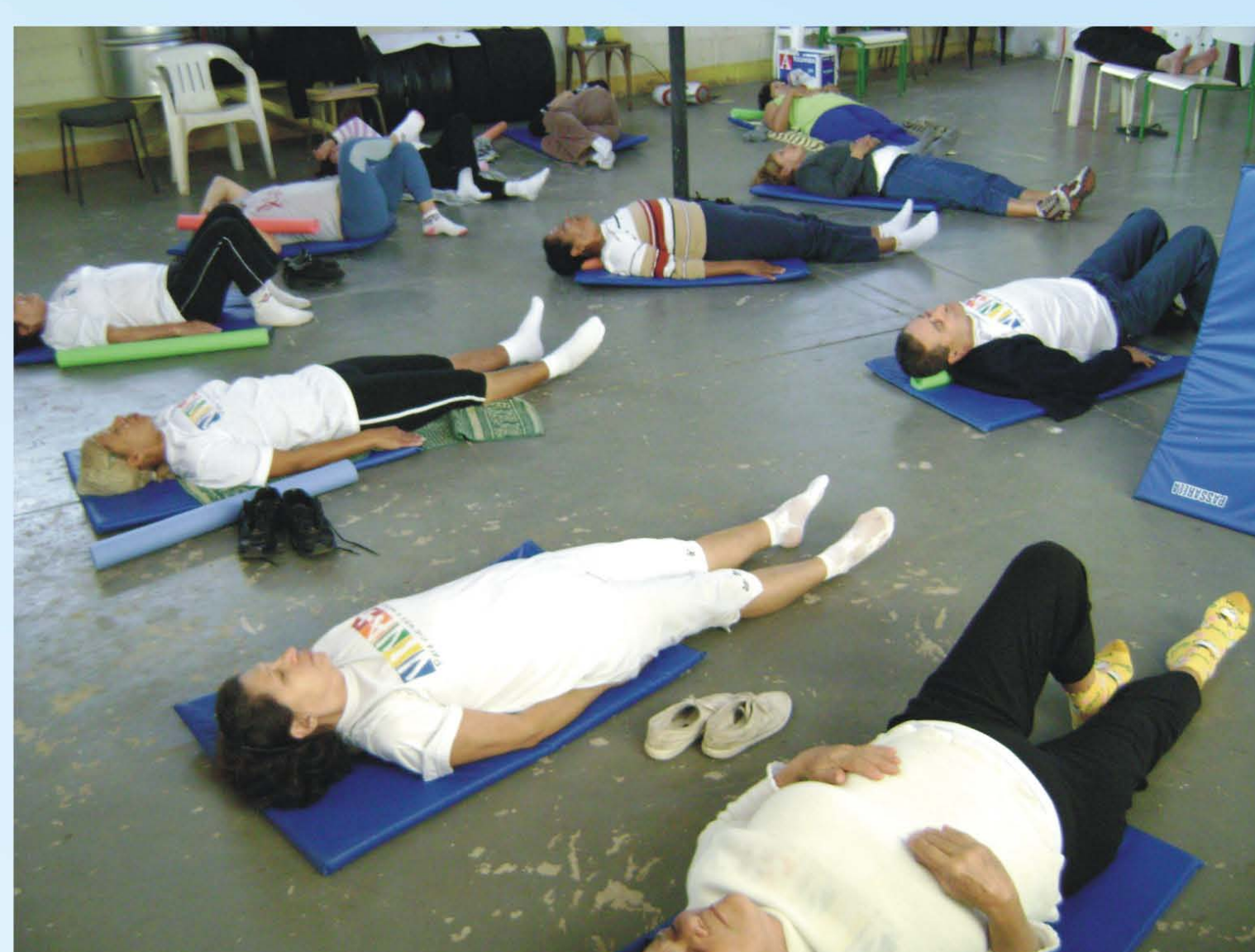
Oficina de Relaxamento