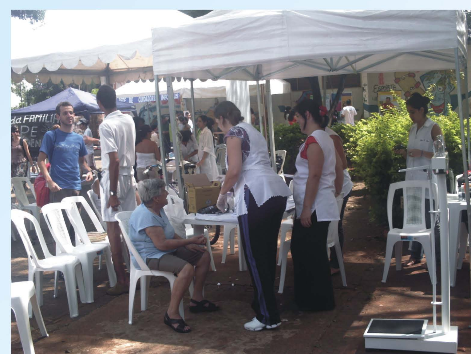
Corredor da saúde na Ação Cidadã