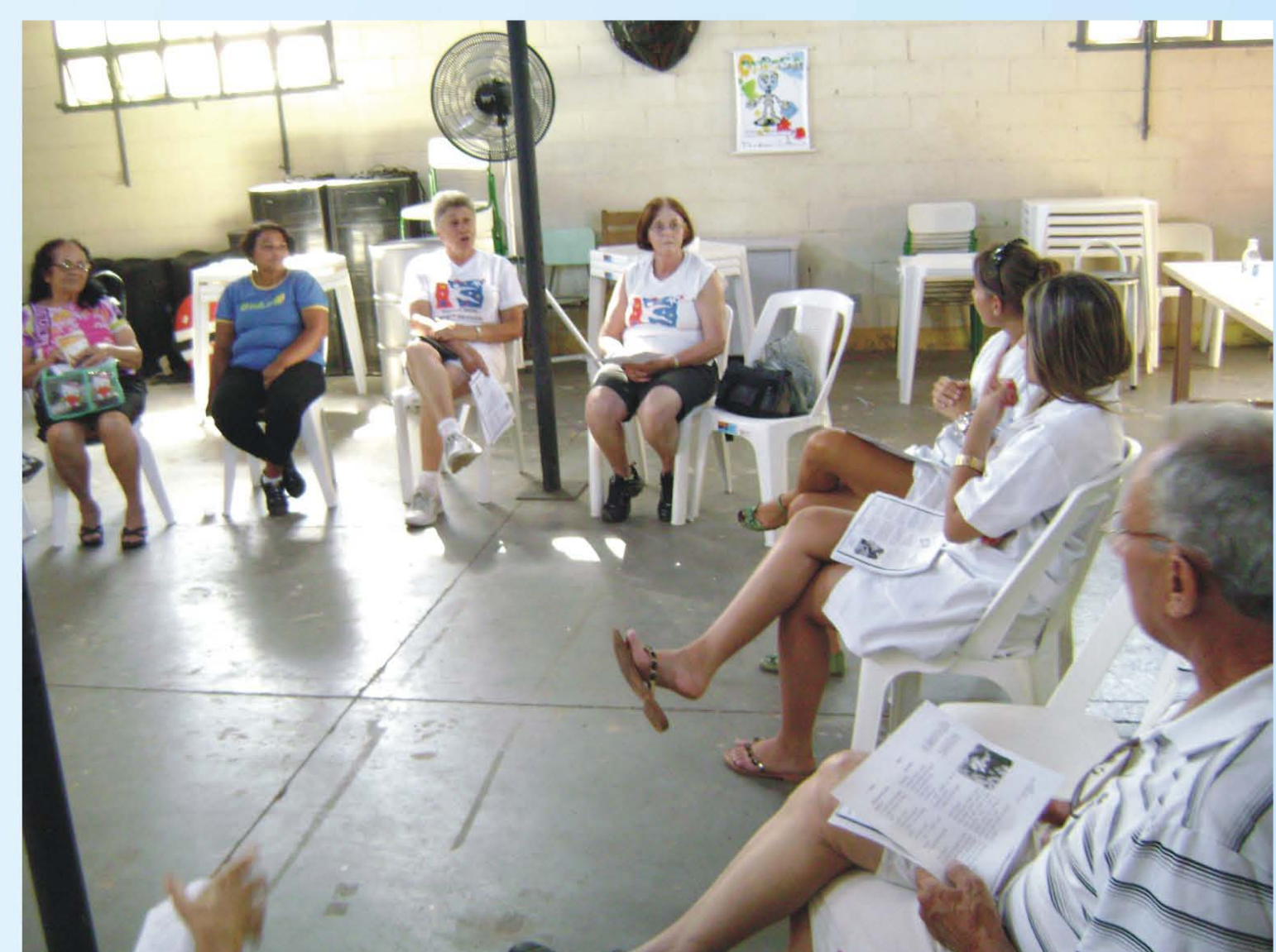
Palestra sobre nutrição na diabetes

Durante toda a semana nas oficinas Cecco Toninha e Pólo do Idoso foram divulgados informações sobre os aspectos da diabetes, importância da prevenção, programação da semana e distribuição de laços azuis como forma de sensibilização para a relevância do tema. As ações mais expressivas na semana foram: a) palestra educativa equipe nutrição - Puc-Campinas (campo de estágio C. S. Integração) através de orientações sobre o tema e desmistificação da relação do alimento e a diabetes respeitando as histórias de vida dos frequentadores. b) mobilização para verificação de exames de glicemia e orientações nutricionais através de uma tenda da saúde no dia municipal do combate a diabetes. Durante o evento ocorreram atividades corporais no Pólo do Idoso e Cecco Toninha como Ginástica Geral e Relaxamento. E também ao longo dos exames colhidos e orientações contamos com a musicalização do Grupo Vocal que animou o evento e trouxe outro contexto importante – cultural e social para lidar com o tema; c) Corredor da saúde, a fim de completar a campanha resolvemos estender mais um dia na Ação Cidadã para ampliação preventiva, pois estaríamos inseridos em um evento promovido pela comunidade educativa da região com apoio Progem, Cecco Toninha e Escolas – Mario Natividade e Hercy Moraes que visa o desenvolvimento comunitário, trocas de conhecimento em um ambiente de diversidades culturais – apresentações artísticas, feira culinária e artesanal entre outros e com grande circulações de moradores.