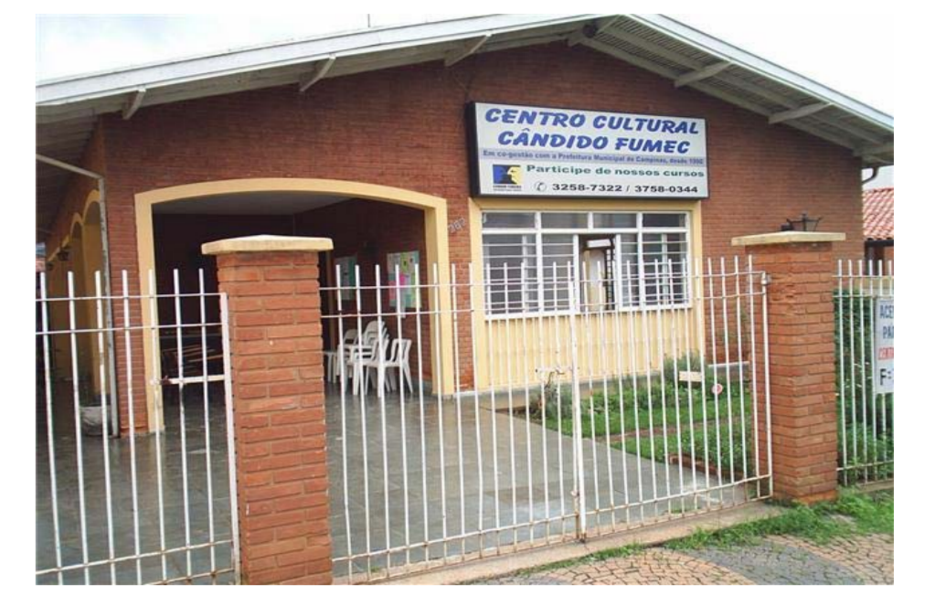
Centro Cultural Cândido/FUMEC

Rua das Castanheiras, nº 47, Vila Boa Vista. TEL: (19) 32452085