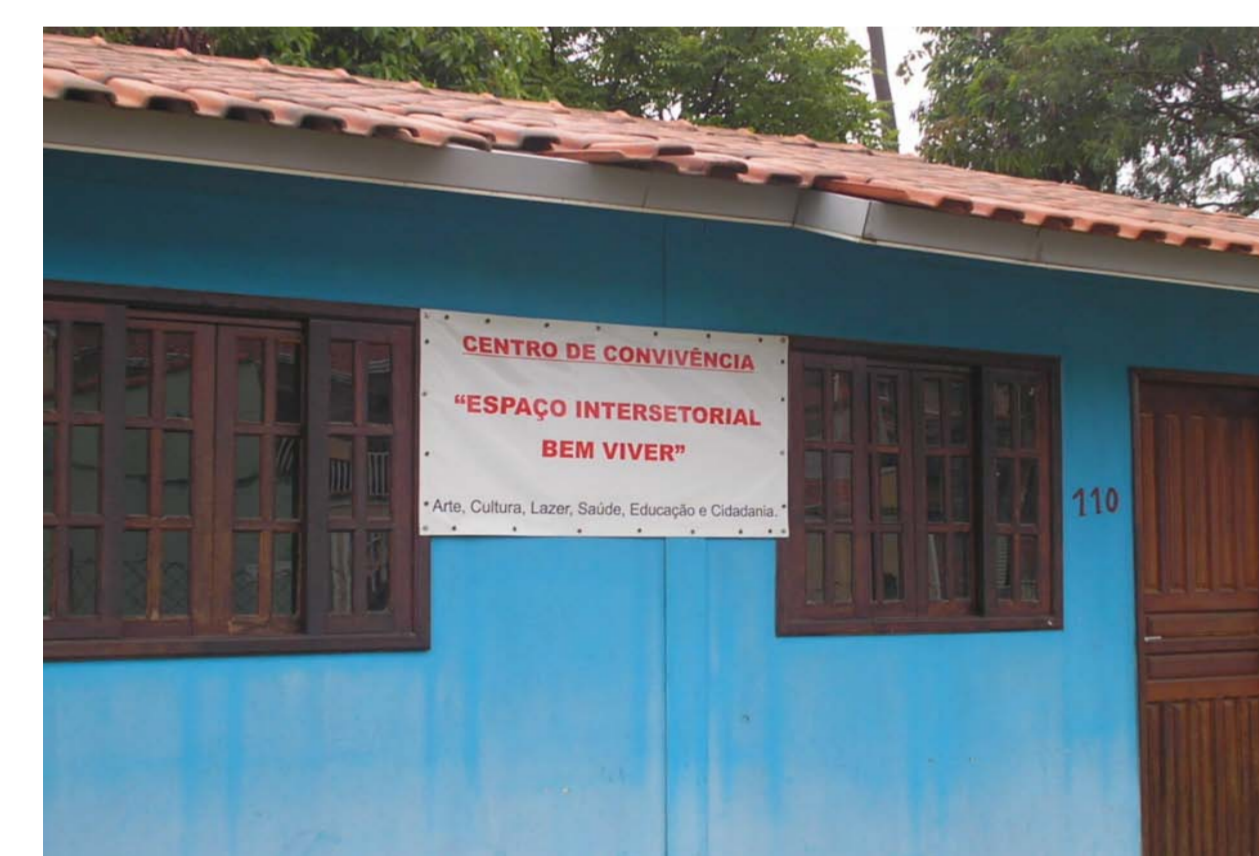
Centro de Convivência Bem-Viver.

Endereço: Rua dos Potiguaras, s/nº, Vila Miguel Vicente Cury. TEL: (19) 32415404/Nextel: 78505378 ID 139*5220 Email: convivenciaearte@candido.org.br