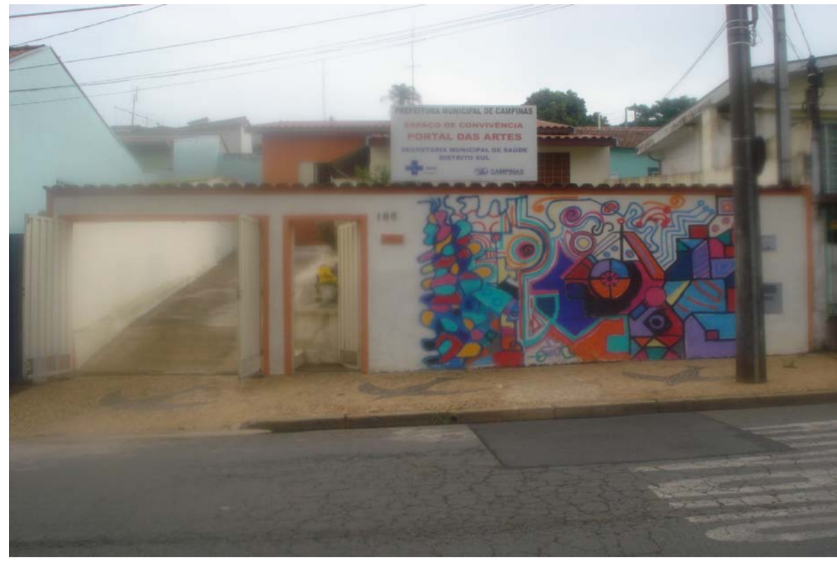
Centro de Convivência Portal das Artes.

Endereço: Rua Serra d' água, 166, Jardim São Fernando. TEL: (19) 32536881 Email: artesnoportal@yahoo.com.br