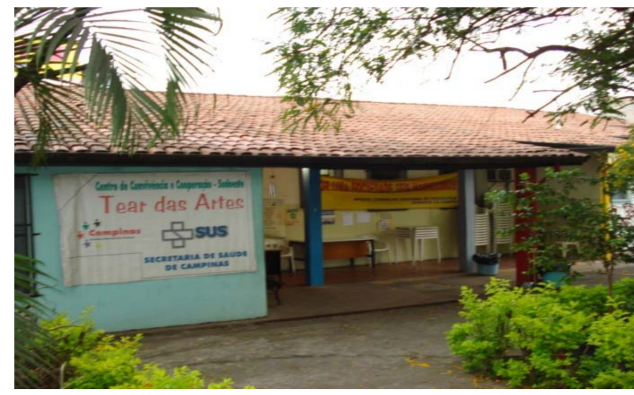
Centro de Convivência e Cooperação Tear das Artes.

Endereço: Rua Serra d' água, 166, Jardim São Fernando. TEL: (19) 32536881 Email: artesnoportal@yahoo.com.br