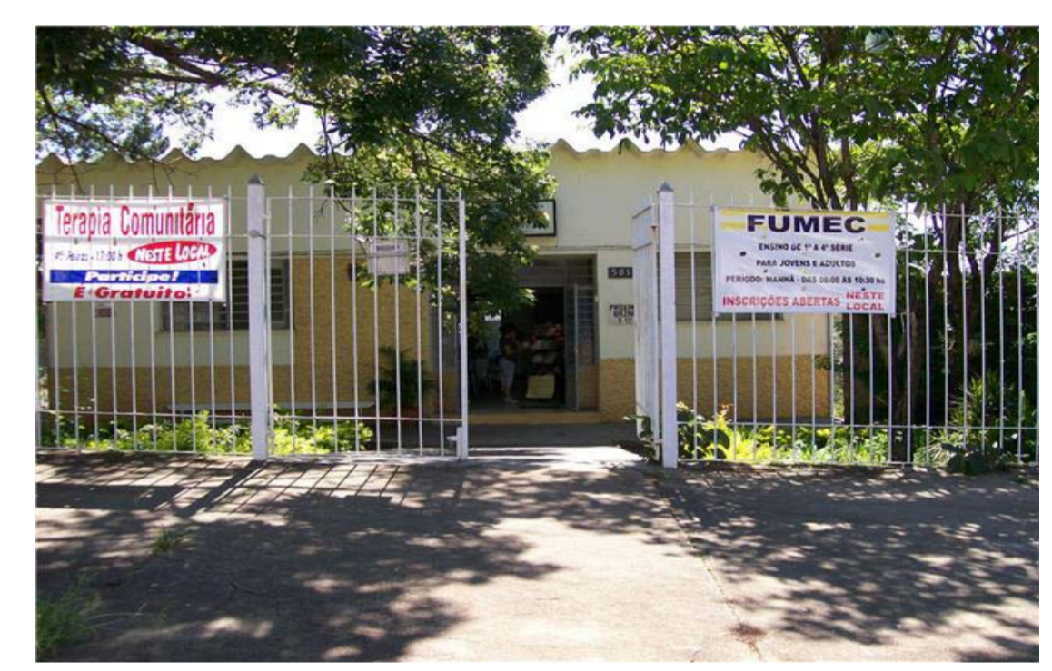
Centro de Convivência Aurélia

Endereço: Rua Beato Marcelino Champagnat, nº 17, Vila Joaquim Inácio. TEL: (19) 3276-8742 Nextel: (19) 7804-2595 - ID: 139*1247 Email: rosa.ventos@candido.org.br