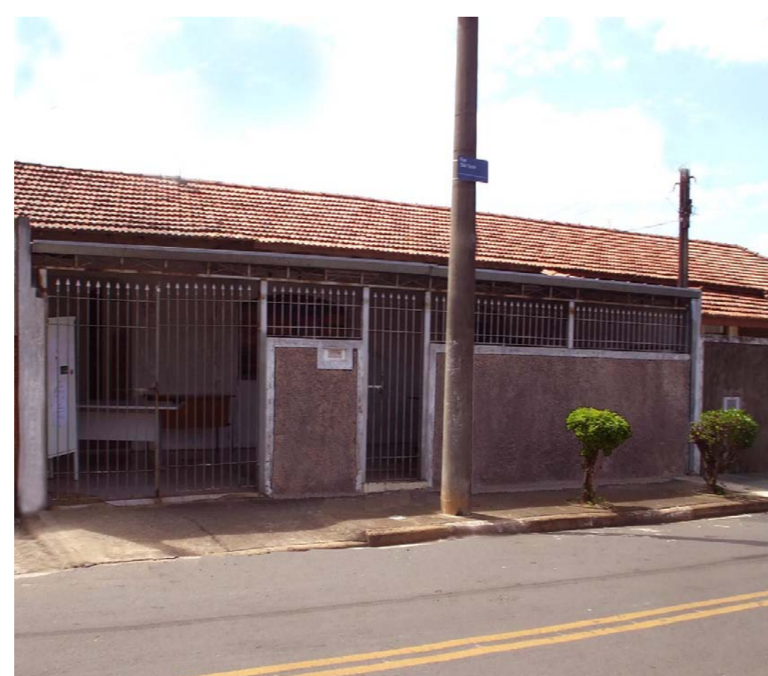
Centro de Convivência e Cultura João de Barro

Endereço: Praça João Prates nº 110, Jardim das Bandeiras II. A praça está localizada entre as ruas: Manoel Militão de Melo, Manoel Bombatti e Artur Avelino Machado. TEL: (19) 32299867 (Contato no CS São José com Ray ou Regolina).