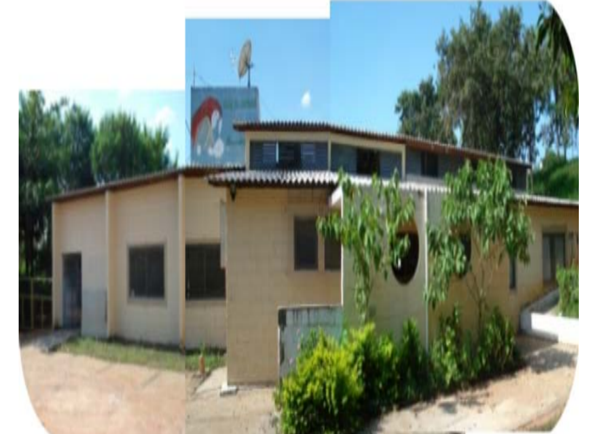
Centro de Convivência e Cooperativa Toninha

Endereço: Rua Luis Antônio de Assumpção Leite nº 501, Vila Proost Sousa. TEL: (19) 32139823