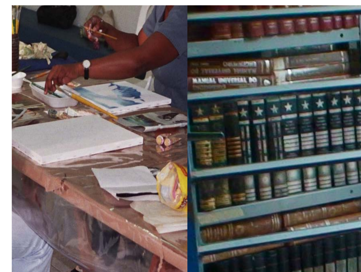
Centro de Convivência Viver e Conviver

Endereço: Rua São Tomé, nº 85, Vila Padre Anchieta. TEL: (19) 32814426