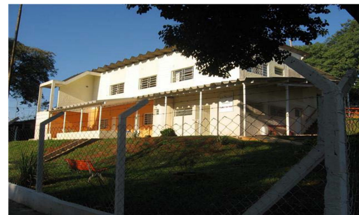
Centro de Convivência Espaço das Vilas

Endereço: Rua Benedito Roberto Barbosa, nº 11, Parque Universitário. TEL: (19) 32668006/32665656. Email: tear_das_artes@yahoo.com.br